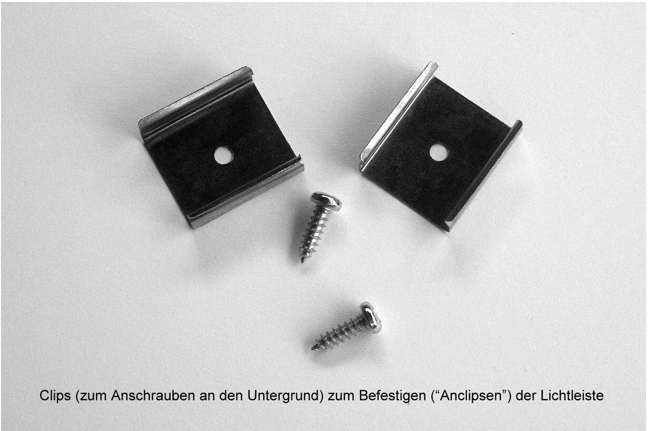
Clips (zum Anschrauben an den Untergrund) zum Befestigen ("Anclipsen") der Lichtleiste