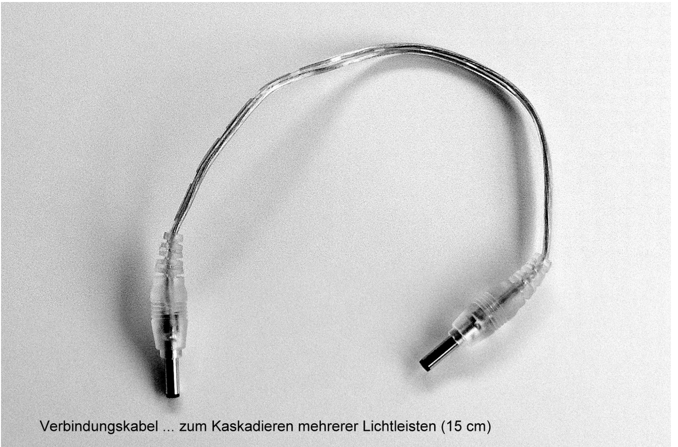
Verbindungskabel ... zum Kaskadieren mehrerer Lichtleisten (15 cm)